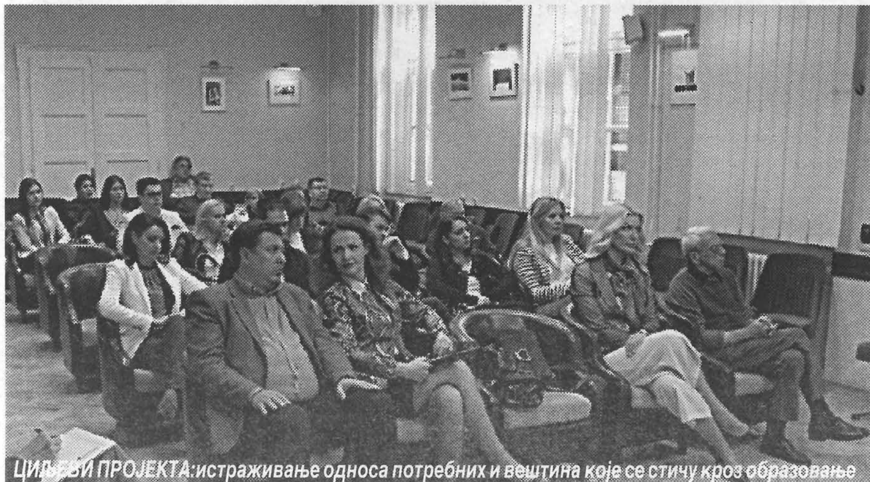
ЦИЉЕВИ ПРОЈЕКТА: истраживање односа потребних и вештина које се стичу кроз образовање